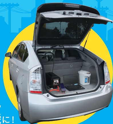
すぐに 使える 発電機に!