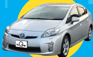
公用車/営業車として お使いのプリウスに