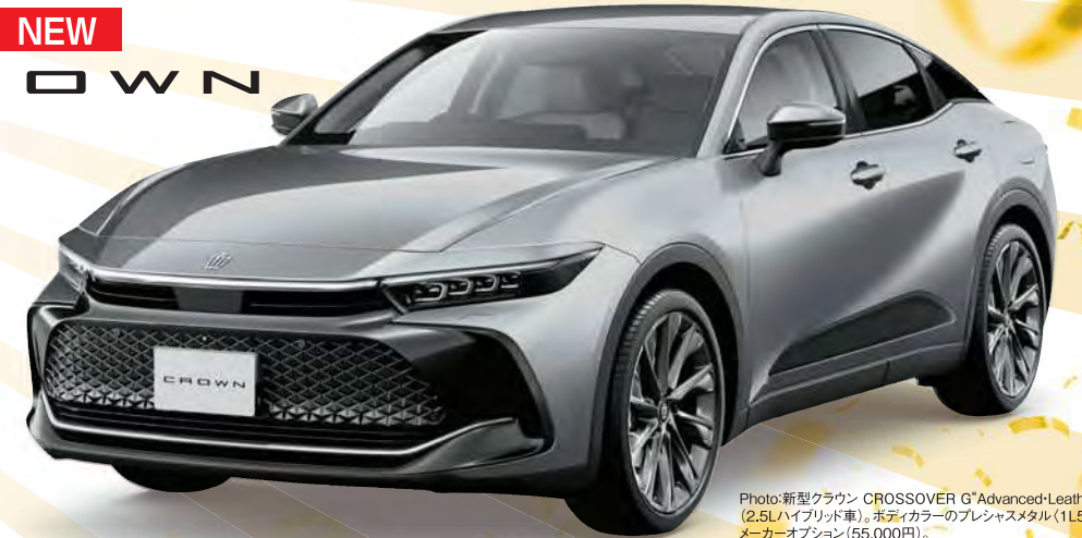
Photo:新型クラウン CROSSOVER G Advanced Leather Package (2.5Lハイブリッド車)。ボディカラーのプレジデントメタル(1L5)はメーカーオプション(55,000円)。

新型クラウン CROSSOVER G Advanced Leather Package (2.5Lハイブリッド車) 車両本体価格 5,700,000円 頭金(または現在お乗りのクルマの下取り査定価格)が 2,000,000円の場合