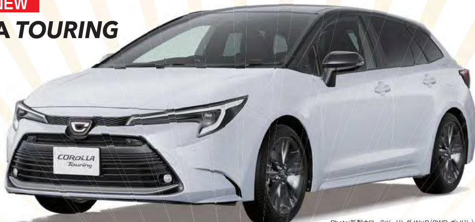
Photo:新型コロラツーリング W×B(2WD・ガソリン)。ボディカラーのアイチチュートブラックマイカ(218)×ブラザーホワイトパールマイカ(089) [2P8]はメーカーオプション(77,000円)。

新型コロラツーリング W×B(2WD・ガソリン) 車両本体価格 2,500,000円 頭金(または現在お乗りのクルマの下取り査定価格)が 500,000円の場合