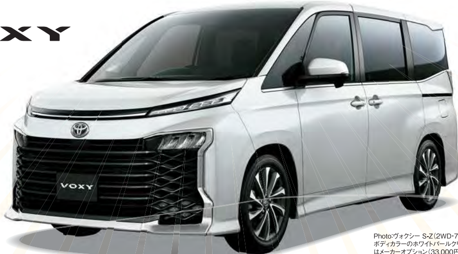
Photo:ヴォクシー S-Z(2WD・7人乗り・ガソリン)。ボディカラーのホワイトパールクリスタルシャイン(070)はメーカーオプション(33,000円)。

ヴォクシー S-Z(2WD・7人乗り・ガソリン) 車両本体価格 3,390,000円 頭金(または現在お乗りのクルマの下取り査定価格)が 700,000円の場合