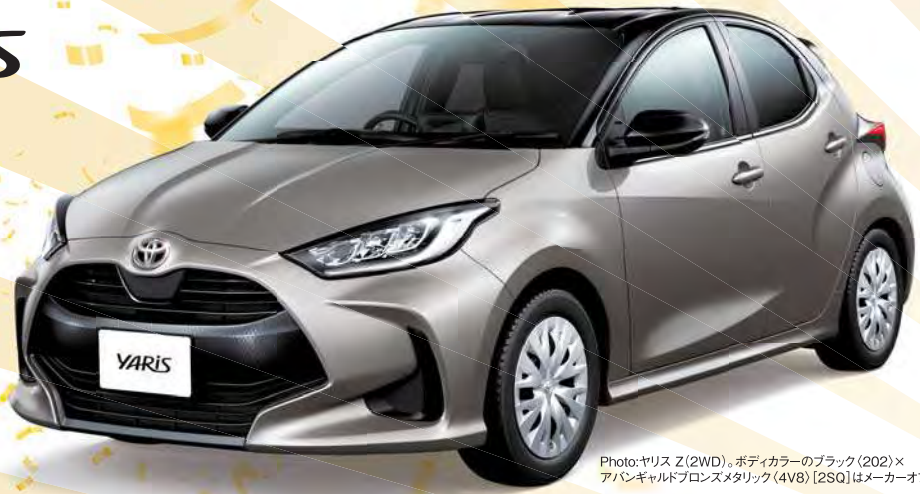
Photo:ヤリス Z(2WD)。ボディカラーはブラック(202)×アバンギャルドクロスメタリック(4V8) [25Q]はメーカーオプション(55,000円)。

ヤリス Z(2WD・1.5Lガソリン) 車両本体価格 2,008,000円 頭金(または現在お乗りのクルマの下取り査定価格)が 500,000円の場合