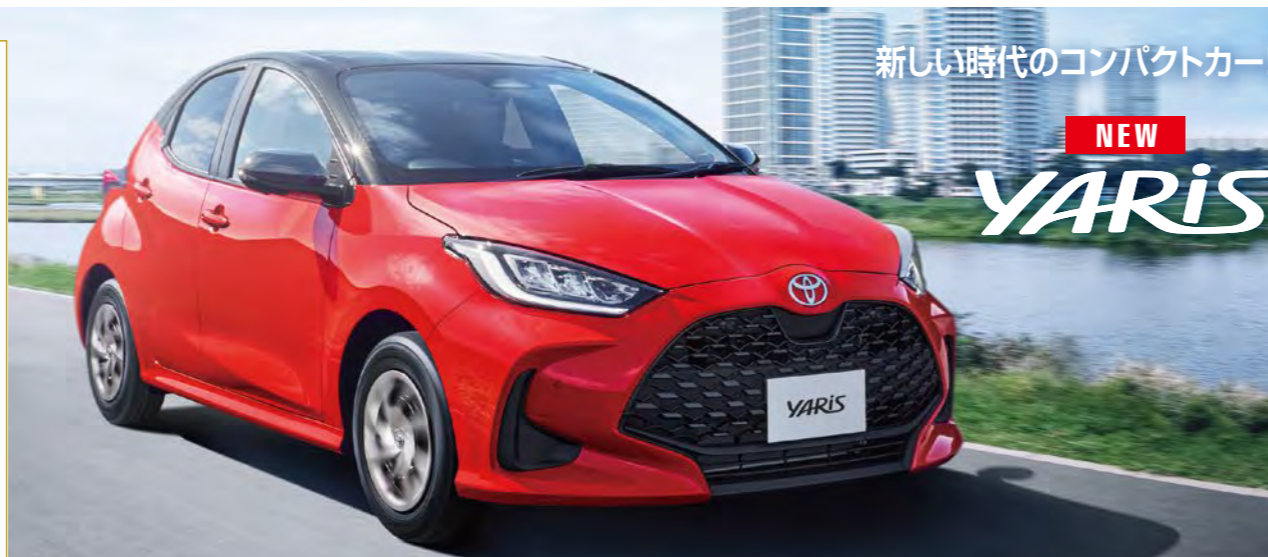
Photo:G(ハイブリッド2WD)、ボディカラーのブラック(202)×コラルクリスタルシャイン(3U7) [2SR]はメーカーオプション。(77,000円(税込))

▼4月支払い開始例 ●頭金(又は下取り) 600,000円 ●ボーナス月(8・1月) 100,000円×10回 ●初回 9,425円 ●最終回お支払い額 -597,740円 ●割賦元金 1,699,000円 ●割賦手数料 268,165円 ●割賦総支払額 2,567,165円 ※ボーナス月につきましては月々のお支払いは加算されません。あくまでも目安としての試算です。※月々のお支払い金額はお支払い開始月によって異なります。