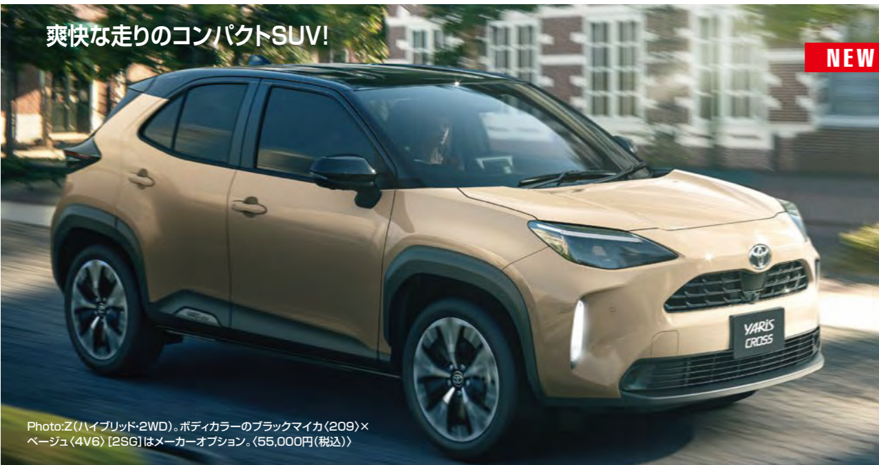
Photo:Z(ハイブリッド2WD)、ボディカラーのブラックマイカ(209)×ベージュ(4V6) [2SG]はメーカーオプション。(55,000円(税込))