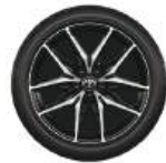
●225/45R19タイヤ(YOKOHAMA ADVAN FLEVA) &専用19×7 1/2Jアルミ ホイール(ダーククリア切削光輝+ブラック塗 装/センターオーナメント/ブラック塗装ホ ールナット付)