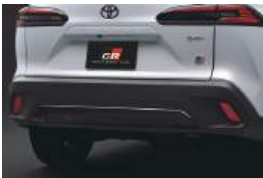
●リアバンパー/リアガーニッシュ(専用ブラック)