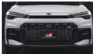
●専用フロントバンパー/専用ラジエターグリル 写真はオプション装着車