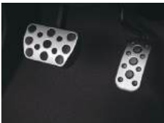
●専用アルミペダル (アクセル・ブレーキ)