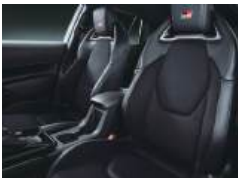
●専用スポーツシート(GRロゴ付)/シート 表皮(合成皮革+プランノープ(R)) [パーフォ レーション&グレーステッチ/スモークシル バーメタリック加飾付]