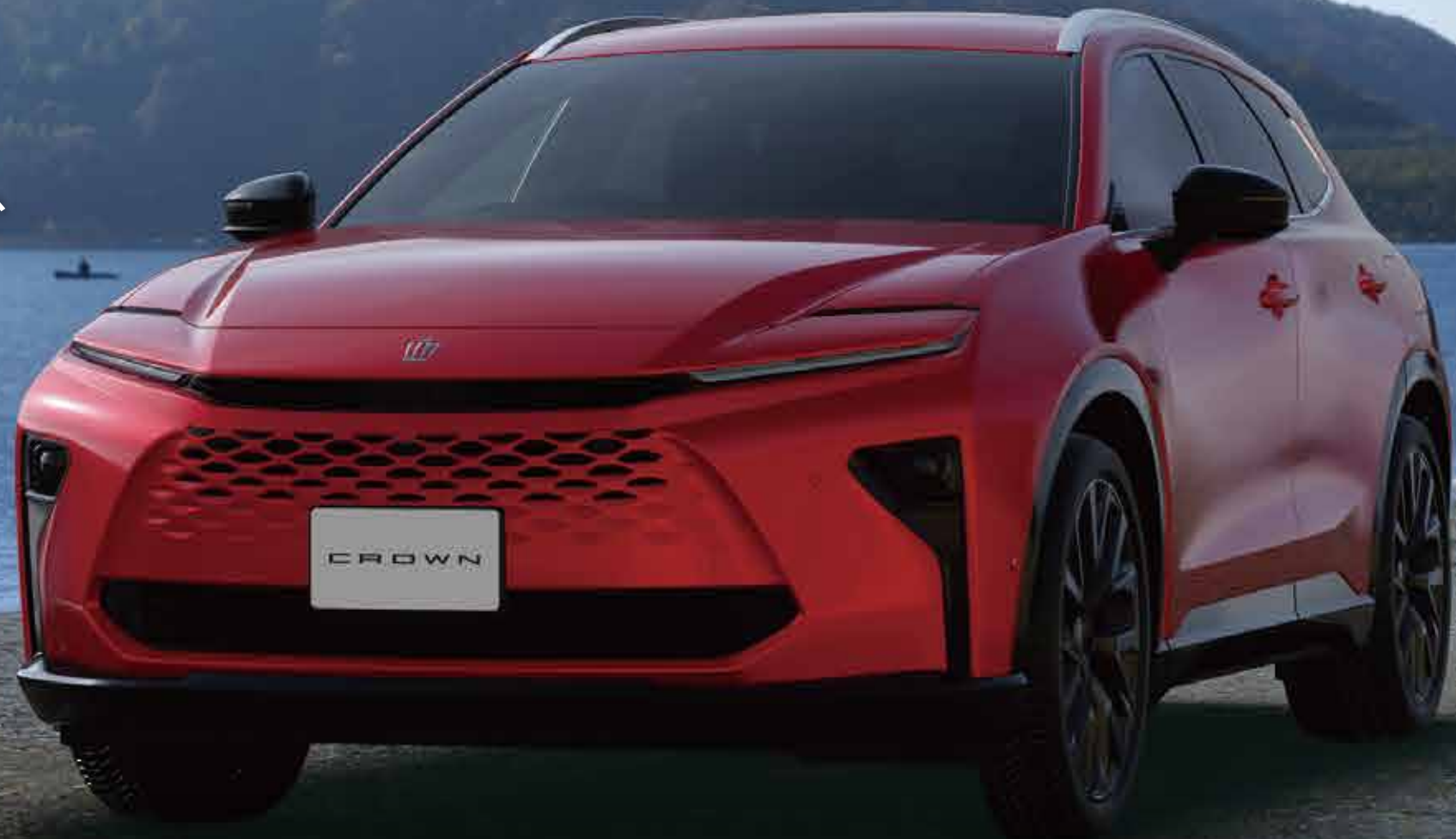
Photo:クラウンエステート Z(ハイブリッド)。ボディカラーのエモーショナルレッドⅢ(3U9)はメーカーオプション(55,000円)。

フルフラット拡張時では、レジャーシーンで快適に過ごせる広さを確保。 アクティブライフにこつろぎをもたらす装備も加わりました。