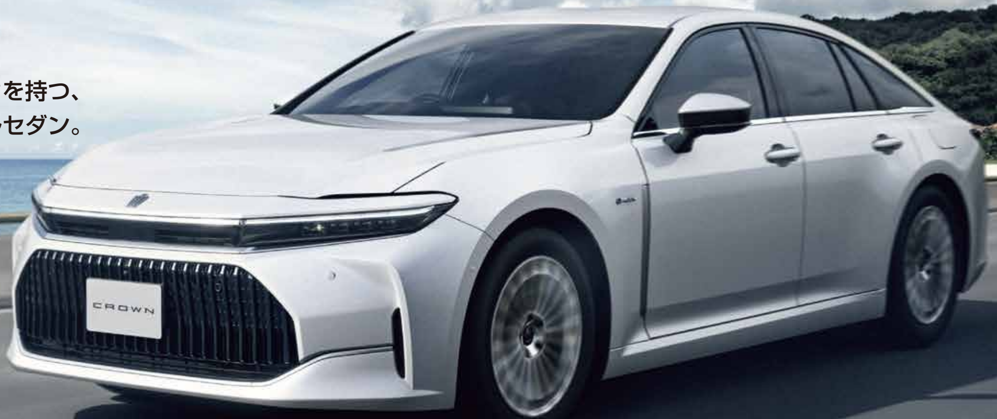
※写真はイメージです。実際の車両とは異なります。ボディカラーのプレシャスホワイトパール(090)はメーカーオプション(55,000円)。