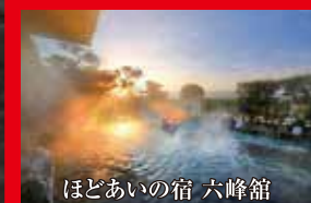
ほどあいの宿 六峰館