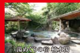
湯めぐりの宿 桶水閣