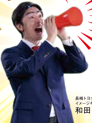
長崎トヨタ イメージキャラクター 和田 毅さん