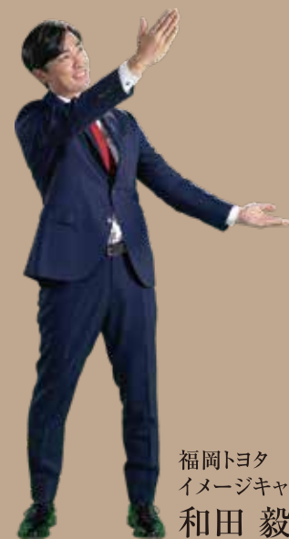
福岡トヨタ イメージキャラクター 和田 毅さん