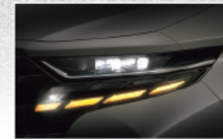
【夜間】LEDコーナリングランプ+LEDシーケン シャルランプ【Executive Lounge, Zに標準 装備, Gにメーカーオプション】