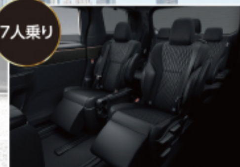
リラックスキャプテンシート【セカンドシート】 【G(7人乗り)に標準装備】