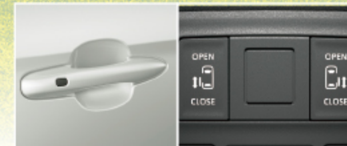
ワンタッチスイッチ付 デュアル(両側) パワースライドドア 62,700円(税込)