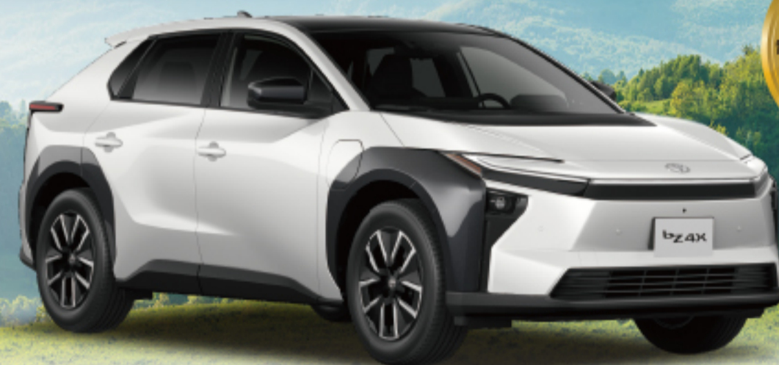
bZ4X Z (FWD) 車両本体価格 5,500,000円(税込)

※photo:Z(FWD)。ボディカラーのプラチナホワイトパールマイカ(089)はメーカーオプション<33,000円>となり、車両本体価格には含まれません。