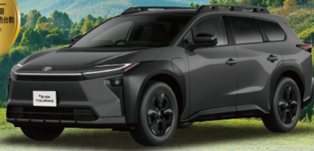
bZ4X ツーリング Z (FWD) 車両本体価格 5,750,000円(税込)

※photo:Z(FWD)。ボディカラーはマグネタイトグレーメタリック(D31)。