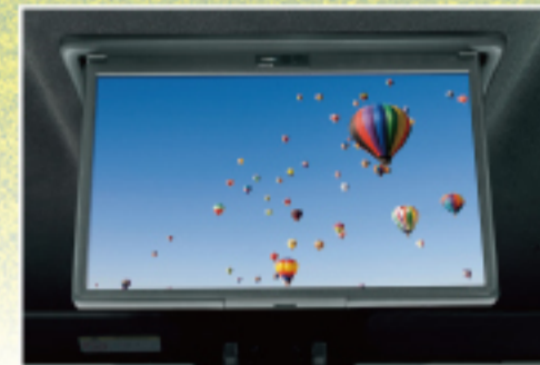
13.2型有機EL後席ディスプレイ V13T-R72R 販売店オプション 140,800円(税込)

※作業時間に応じた取付費が別途必要となります。詳しくは、店舗スタッフにお尋ねください。