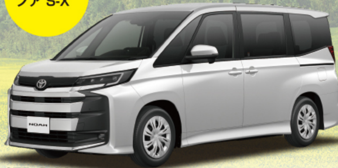
ノア S-X (1.8L・ハイブリッド・2WD) 車両本体価格 3,261,500円(税込)

※photo:S-X(2WD・7人乗り)。ボディカラーのプラチナホワイトパールマイカ(089)はメーカーオプション<33,000円>となり、車両本体価格には含まれません。