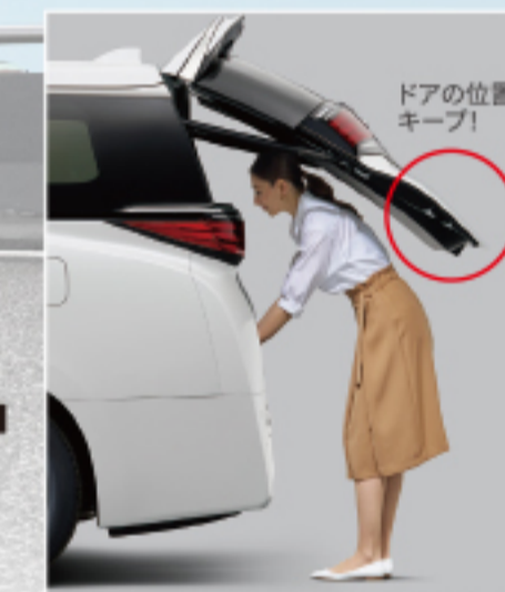
パワーバックドア(ロックアイジーセンサー検 み込み防止機能・停止位置メモリー機能・パワーバ ックドアスイッチ(車両サイド・バックドア下端)付) 【Executive Lounge, Zに標準装備, Gにメーカー オプション】スマートキー(2個)がO.G.入りとなりま す。