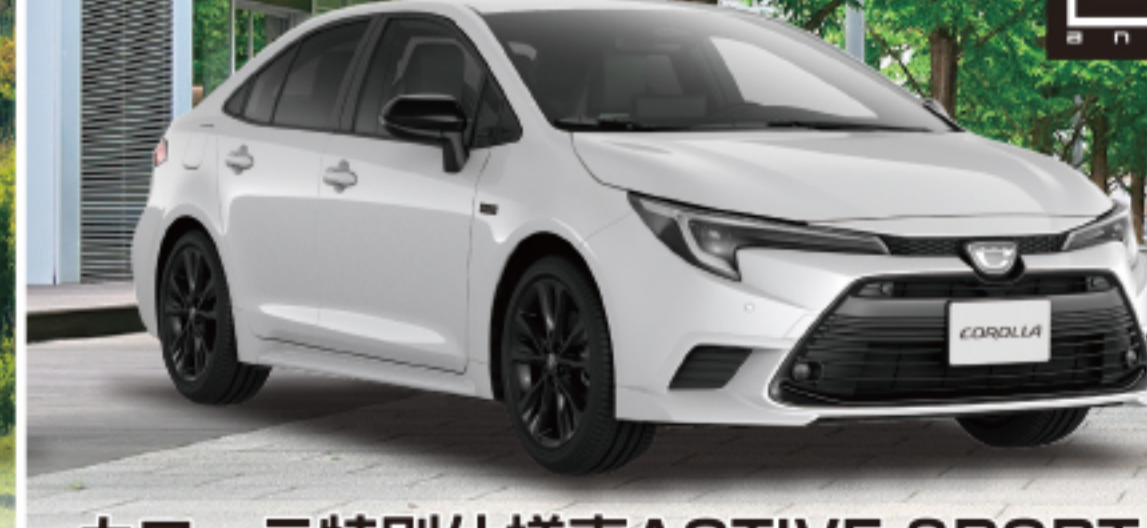
カローラ特別仕様車ACTIVE SPORT (1.8L・ハイブリッド・2WD) 車両本体価格 3,231,800円(税込)

※photo:Z(FWD)。ボディカラーはマグネタイトグレーメタリック(D31)。