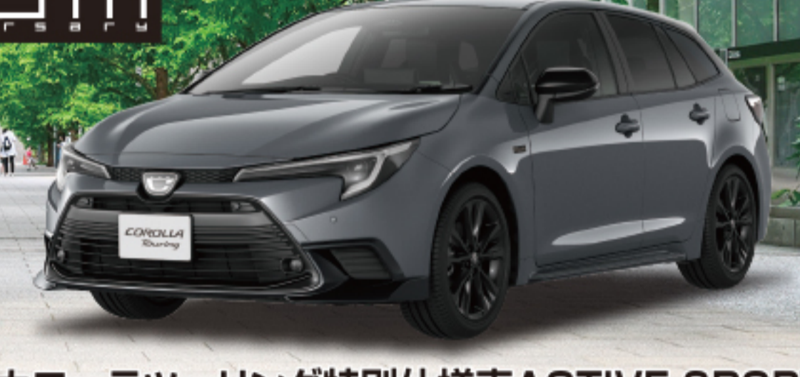
カローラツーリング特別仕様車ACTIVE SPORT (1.8L・ハイブリッド・2WD) 車両本体価格 3,282,400円(税込)

※photo:カローラ 特別仕様車 ACTIVE SPORT(2WD)。ボディカラーのプラチナホワイトパールマイカ(089)はメーカーオプション<33,000円>となり、車両本体価格には含まれません。