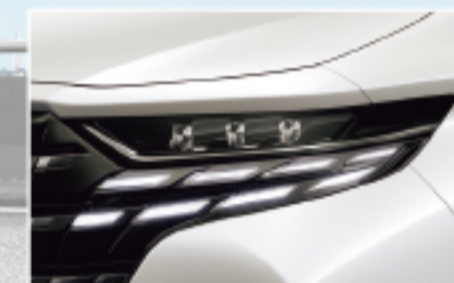
【デイルイ】3組LEDヘッドランプ(ハイロービーム アウトレベリング機能付)+LEDクリアランスラ ンプ(デイルイランニングランプ機能付)+アダ プティブハイビームシステム(AHS)【Executive Lounge, Zに標準装備, Gにメーカーオプション】