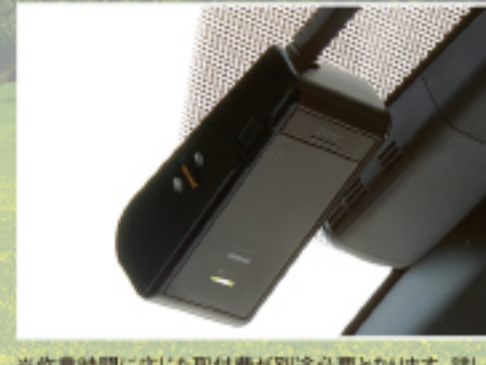
カメラ一体型ドライブレコーダー DRT-H68A 販売店オプション 21,450円(税込)

※作業時間に応じた取付費が別途必要となります。詳しくは、店舗スタッフにお尋ねください。