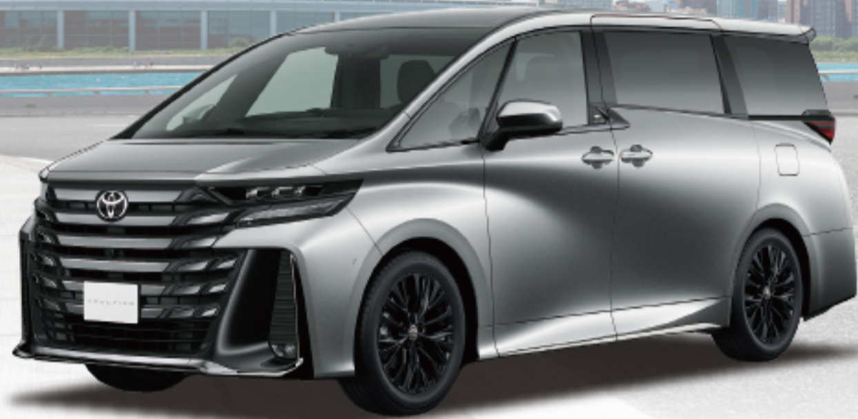
ヴェルファイア Z Premier (2.5L・ハイブリッド・2WD) 車両本体価格 7,099,400円(税込)

※photo:Z Premier(ハイブリッド・2WD)。ボディカラーのプレシャスメタリック(1L5)は、メーカーオプション<55,000円>となり、車両本体価格には含まれません。