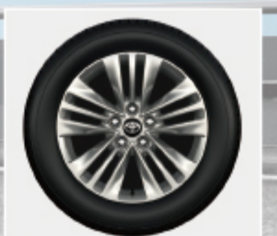
225/60R18タイヤ&18x7Jアルミホ ール(ハイパーロムメタリック塗装) 【Zに標準装備, Gにメーカーオプション】