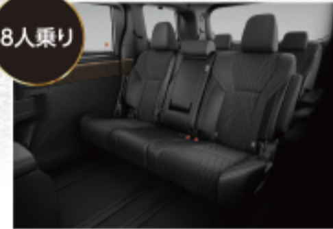
6/4分割チップアップシート【セカンドシート】 【G(8人乗り)に標準装備】