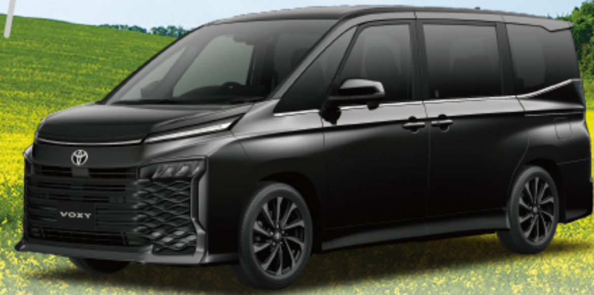
ヴォクシー S-Z (1.8L・ハイブリッド・2WD) 車両本体価格 4,127,200円(税込)

※photo:S-Z(2WD・7人乗り)。ボディカラーはニュートラルブラック(229)。