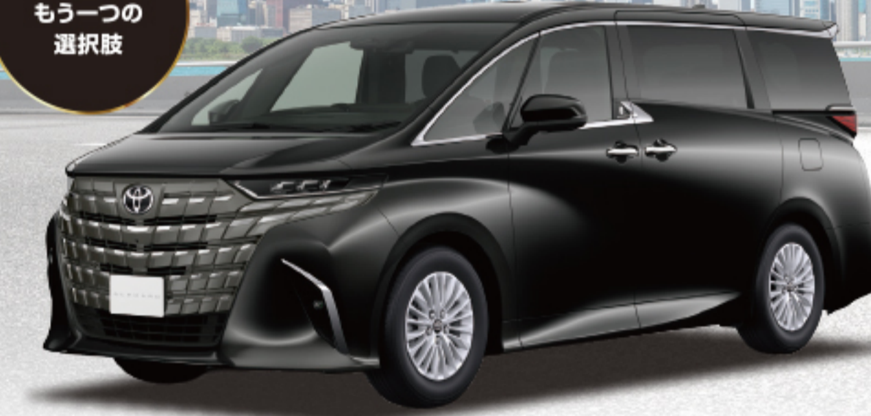
アルファード G (2.5L・ハイブリッド・2WD) 車両本体価格 5,599,000円(税込)

※photo:G(ハイブリッド・2WD・8人乗り)。ボディカラーはニュートラルブラック(229)。